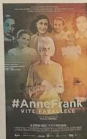
#AnneFrank. Vite Parallele

Tanti momenti promossi dall'amministrazione comunale insieme alle associazioni del territorio per riflettere su queste ricorrenze, che hanno segnato tremende pagine nella storia mondiale del XX secolo. ■ M. Bon.