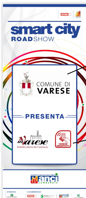
ESEMPIO GRAFICA Comune di Varese