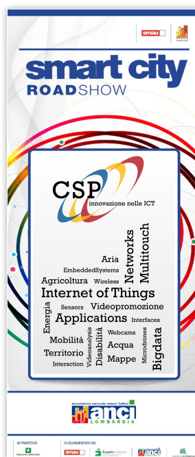
ESEMPIO GRAFICA Azienda